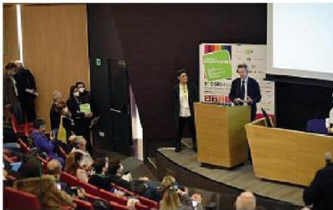
Al Mann Un momento dei lavori del Salone della responsabilità sociale e condivisa

Al primo cittadino è stato presentato il progetto esecutivo per la realizzazione nel 2022 degli Stati generali del Mediterraneo che a ottobre del prossimo anno saranno la punta di diamante della decima edizione del Salone, con attività divulgative e di networking affidate a testimonial d'eccezione. «Parlare di sostenibilità e responsabilità sociale su scala mediterranea è di enorme importanza per Napoli, che ha bisogno di un modello innovativo di sviluppo e di crescita. Affrontare temi quali inclusione e riduzione dei divari in dimensione transnazionale è un tema di enorme importanza», ha commentato Manfredi. Con una trenti-