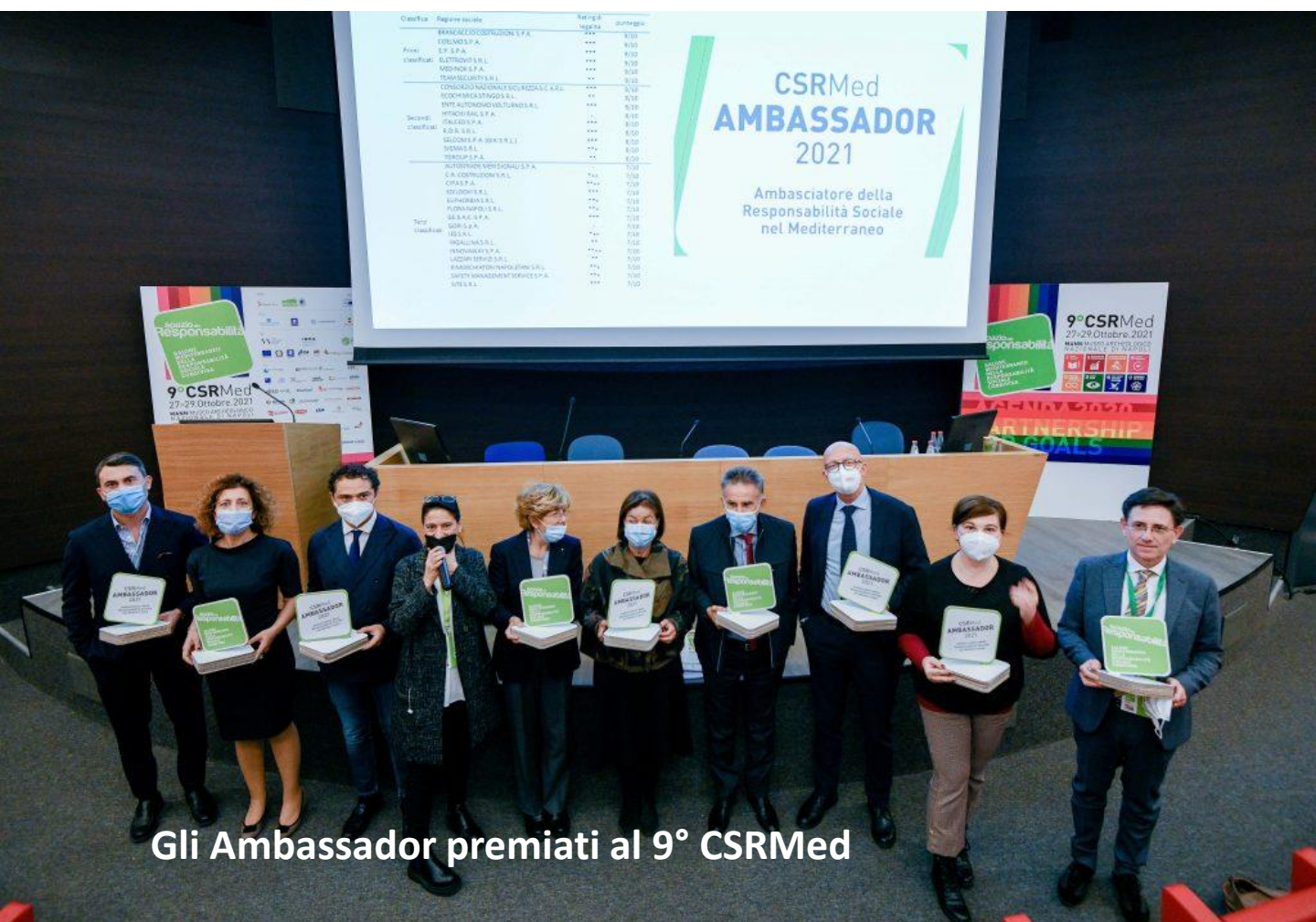
Gli Ambassador premiati al 9° CSRMEd